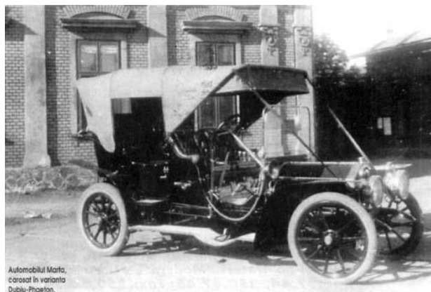
Automobilul Marfa, carosal în variația Dublu-Phaeton.

Rolul hub-urilor culturale și a structurilor care le gestionează este să contribuie la :